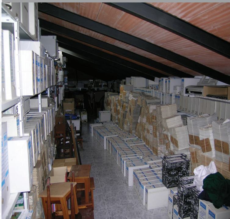
Archivo Municipal del Cabeza la Vaca antes de la elaboración del Inventario.