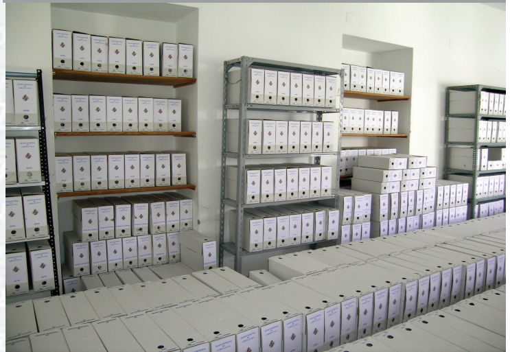
Archivo Municipal de Cabeza la Vaca, después de la elaboración del Inventario.