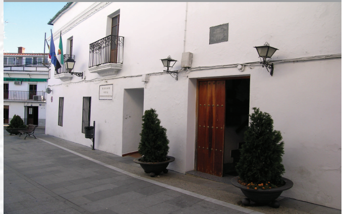
Ayuntamiento de Cabeza la Vaca