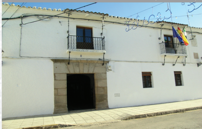
Ayuntamiento de Bodonal de la Sierra