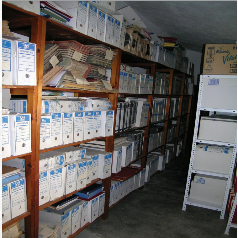
Archivo Municipal de Bodonal de la Sierra antes de la elaboración del inventario.