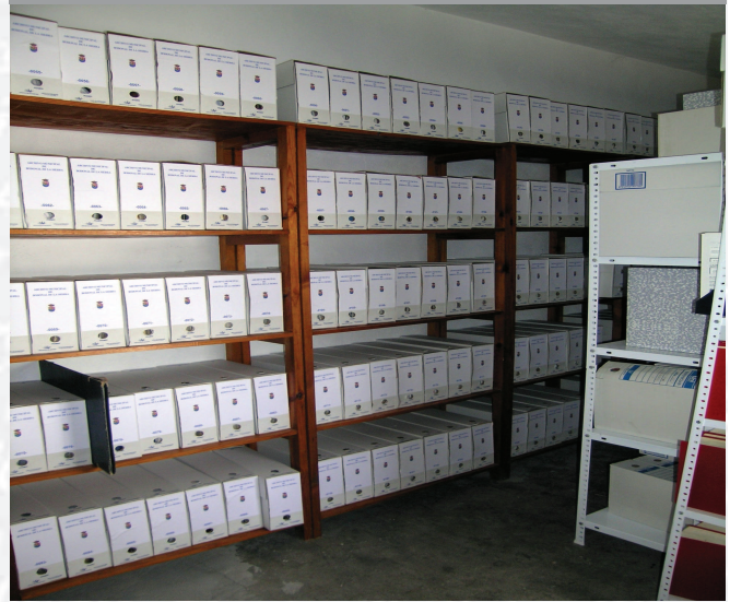
Archivo Municipal de Bodonal de la Sierra después de la elaboración del Inventario.